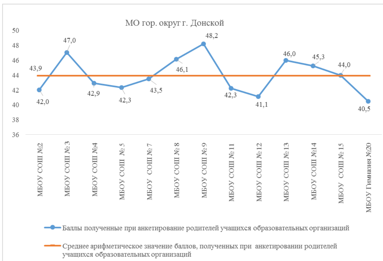
Рис.56. Результаты опроса родителей учащихся образовательных организаций МО гор. округ г. Донской

В гор. округе г. Донской наиболее высокие результаты по анкетированию родителей в МБОУ ЦО № 1 (48,2 балла). Самый низкий показатель в МБОУ Гимназия №20 (40,5 балла), родители учащихся из школы МБОУ СОШ №1 в анкетировании не участвовали (рис. 56).