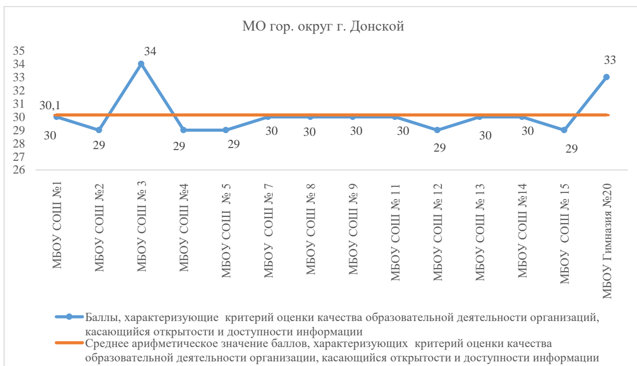
Рис. 16. Оценка качества образовательной деятельности организации МО гор. округ г. Донской, касающаяся открытости и доступности информации

В МО г. Донской наиболее высокие баллы по первому блоку получили МБОУ СОШ № 3 (34 балла), наименьшее количество баллов в МБОУ СОШ № 2 (29 баллов), МБОУ ЦО № 4 (29 баллов), МБОУ СОШ № 5 (29 баллов), МБОУ ЦО № 2 (29 баллов), МБОУ СОШ № 3 (29 баллов). (рис. 16).